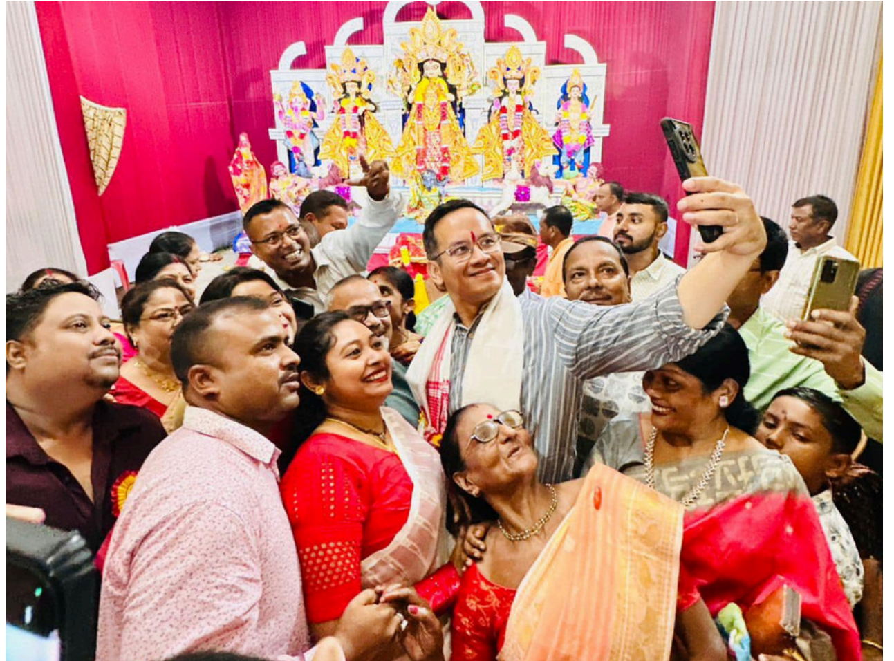
ৰাইজৰ মৰম আৰু আগ্ৰহৰ প্ৰতি সৰ্ব্বাঙ্গীৰে সাংসদ গৌৰৱ গগৈয়েও উঠিলে চেলফি

হৈ পৰিয়ালে এখন ঠেলাৰ ব্যৱস্থা কৰে। মৃতদেহ ঠেলাত তুলি প্ৰায় ২০ কিলোমিটাৰ এলেকা ঠেলি নিয়ে। ঘটনাই মাজুলীত প্ৰতিক্ৰিয়া সৃষ্টি কৰিছে। তথ্য-প্ৰযুক্তিৰ যুগত ঠেলাত মাজুলীৰ মানুহে মৃতদেহ ঘৰলৈ নিবলগীয়া হৈছে। উন্নয়নৰ ঢাক ঢোল বজাই থকা চৰকাৰখনে মাজুলীৰ স্বাস্থ্য খণ্ডৰ কেনে উন্নয়ন কৰিছে এই ঘটনাই স্পষ্ট কৰিছে। এখন স্বৰ্গৰথ বাহন নাপায় মাজুলীবাসীয়ে। মাজুলীবাসীৰ বাবে ইয়াতকৈ দুৰ্ভাগ্যজনক কথা কি হ'ব পাৰে বুলি কয় সচেতন ৰাইজে। মাজুলীৰ অকৰ্মণ্য বিধায়কগৰাকীয়ে মাজুলীৰ স্বাস্থ্য খণ্ডৰ উন্নয়নৰ কথাভাৱক বুলি মতপোষণ ক্ষোভ ব্যক্ত কৰিছে ৰাইজে। কেৱল বিজেপিয়ে সদস্য ভৰ্তি অভিযান চলাই থকাটোৱেই উন্নয়ন নে কি বুলি প্ৰশ্ন কৰাৰ লগতে মাজুলীৰ সমস্যাক বিধায়কগৰাকীয়ে গুৰুত্ব দিয়ক বুলি মতপোষণ কৰে সচেতন ৰাইজে।