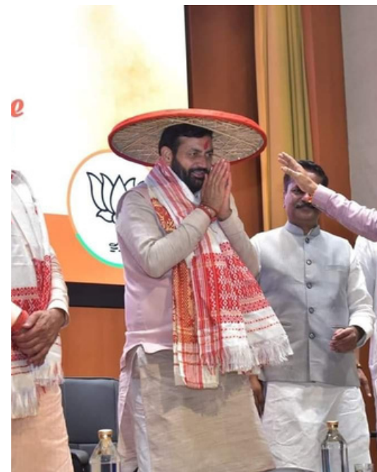
অসম বিজেপিৰ কাৰ্যালয়ত হাৰিয়ানাৰ নতুন মুখ্যমন্ত্ৰী