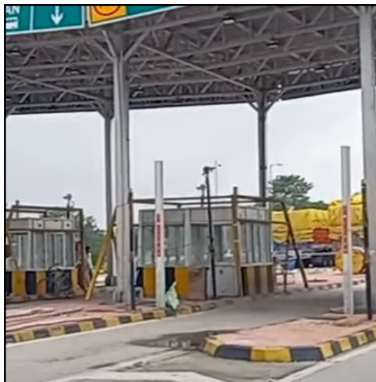
কলিয়াবৰৰ ছলুঙত সাজু কৰা হৈছে টোলগেট

ই-সংবাদ, ১৪ অক্টোবৰঃ এটা দিন আৰু এটা নিশা অসমত কটাই যোৱা হাৰিয়ানাৰ মুখ্যমন্ত্ৰী নয়্যৰ সিং ছৈনীৰ সোঁৱৰ-বাঁৱে থাকিল সৰ্বানন্দ সোণোৱাল পত্নী নেতাসকল। সৰ্বানন্দ সোণোৱাল পত্নীৰ নেতা বুলি চৰ্চিত শেৰাংশ ৪ পৃষ্ঠাত